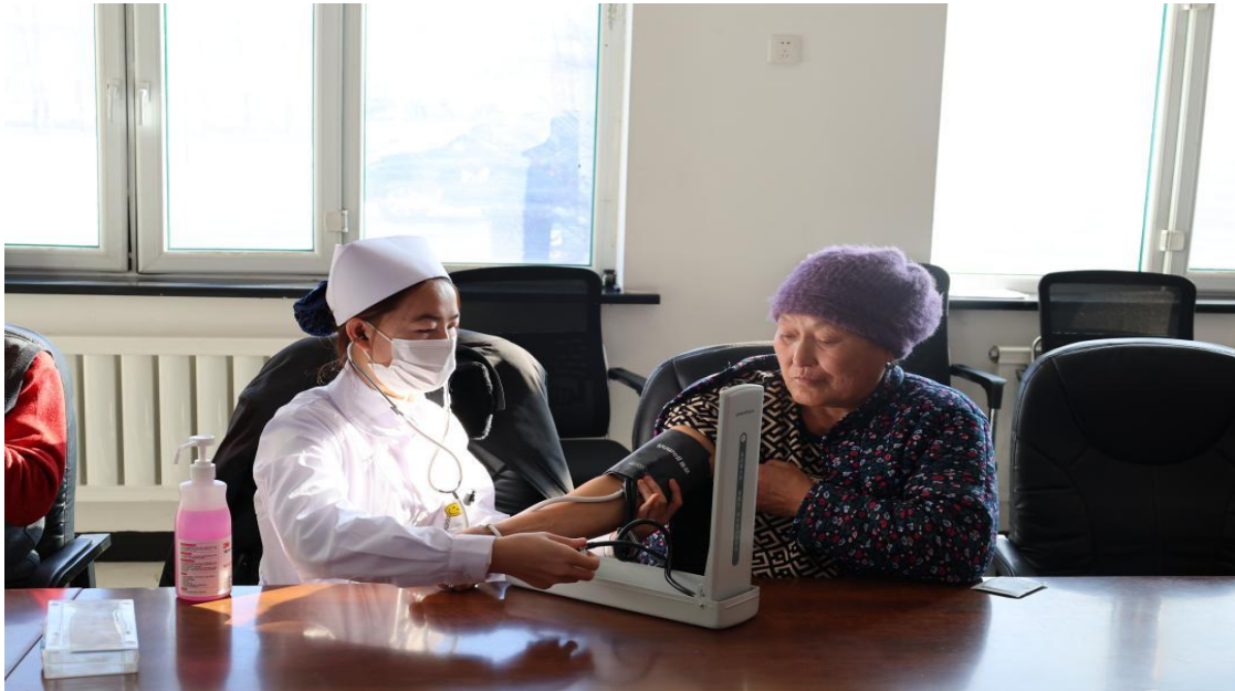
图 33 党员教师到社区为老年人测量血压