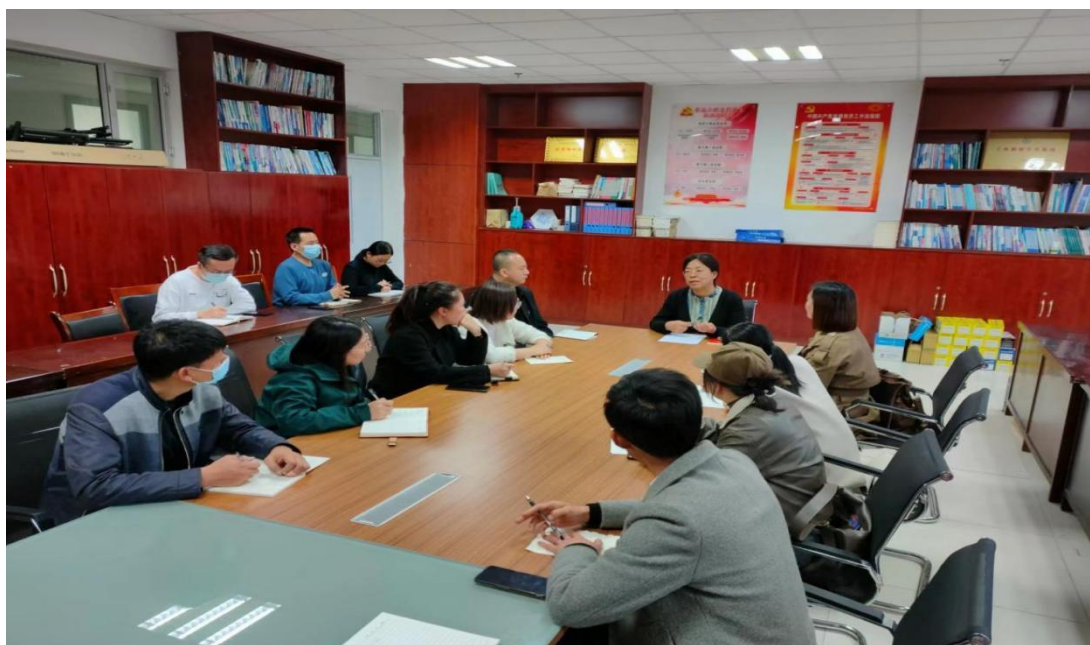
图5 学校骨干专业教师赴内蒙古机电学院研制专业群人才培养方案

学校与内蒙古机电学院专业团队共同研制汽修专业群人才培养方案，确保人才培养方案质量高、指导强、效果好。一是开展线上首轮研讨，制定出方案初稿。二是开展线上网络调研，向在校生、专业毕业生、专业教师、企业管理者、企业一线员工发放问卷二维码。三是组织骨干教师一起到帮扶学院学习调研。四是确定典型工作岗位，通过大数据抓取信息确定群内专业的典型工作岗位。五是召开专业群课程体系构建专家研讨会，确定群内专业开设的课程。通过以上方式，学校高标准研制汽车运用与维修专业群人才培养方案。