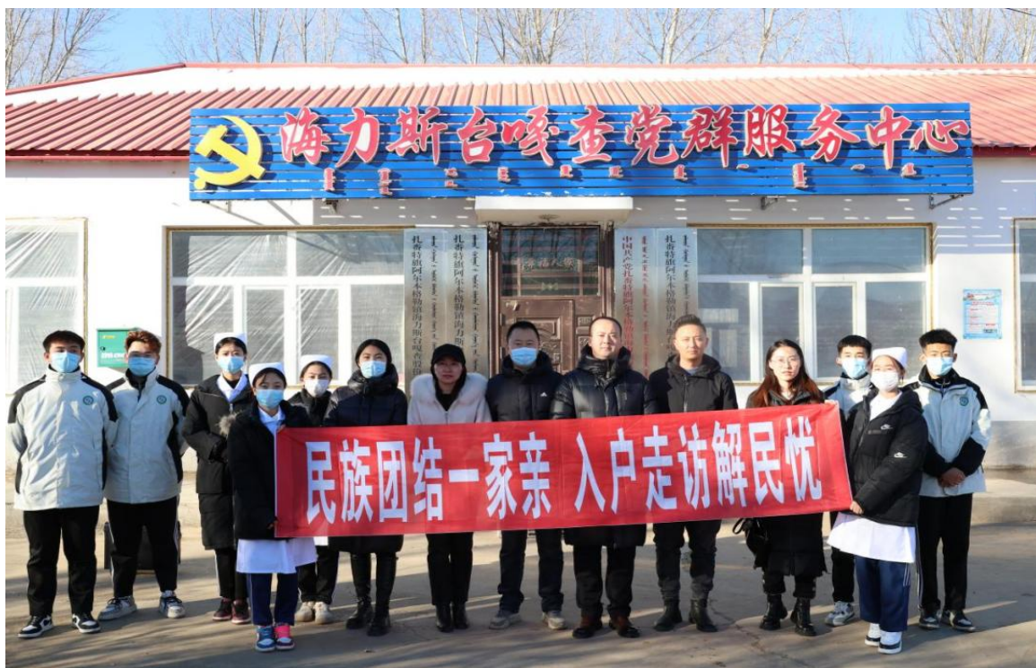
图 27 学校与少数民族村党支部开展共建

为深入学习贯彻中央民族工作会议精神、习近平总书记关于加强和改进民族工作重要思想，促进师生牢固铸牢中华民族共同体意识，学校成立了以党总支书记负总责的民族团结工作领导小组，通过开展党建带团建、打造“石榴籽课堂”、开展“同心筑梦”、送技下乡、专题讲座、校园文化艺术节、民族特色课桌舞竞赛、职业技能培训提升、田径运动会等系列活动，推动学校各族师生牢固树立正确的国家观、历史观、民族观、文化观、宗教观，将铸牢中华民族共同体意识植根广大师生心灵深处。