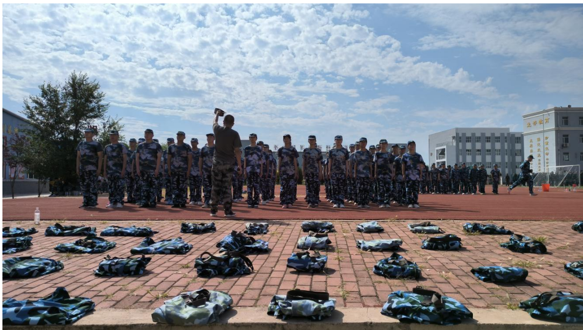
图 36 2023 年学生暑期学生军训

学校根据职业教育特点，将安全工作作为重中之重。一是健全安全管理制度，明确干部、教师安全职责，落实带值班制度，确保每个环节都有专人负责。二是开展安全教育宣传，通过安全知识讲座、法治教育、应急演练等活动提高学生的安全意识和自我保护能力；建立安全隐患排查机制，及时发现并消除安全隐患。三是实施准军事化管理，通过购买社会服务方式，聘用 10 名退役军人参与学生日常管理，在学生养成教育中起到了较明显的效果。四是加强心理健康教育，定期摸排学生情况，及时疏导化解心理问题。五是强化家校合作，通过家长会、家访等方式，家校密切配合确保学生安全。六是建立学生安全档案，对学生的安全情况进行跟踪管理。通过以上措施实施，有力保障了学校教育教学正常开展。