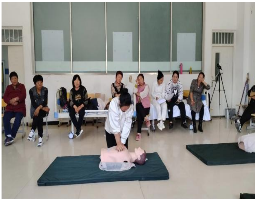
图 20 培训实操技能

学校专业教师利用线上服务平台，为当地百姓讲解护理、农学、畜牧等专业理论，通过线上培训提高农牧民对农作物、畜禽的日常管理水平，有效满足了农牧民对相关知识的迫切需求，助力农牧民提升种植、养殖技术，增加家庭收入。结合具备职业技能培训和认证资质，学校承担 30 名家庭经济困难农牧民“病人陪护”（护工）资质培训，培训采取理论与实操相结合方式开展，经过考核全员获得了职业技能证书，有力服务农牧民就业或再就业。