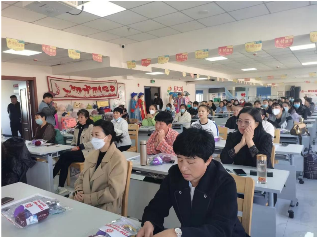
图 19 手工编织培训