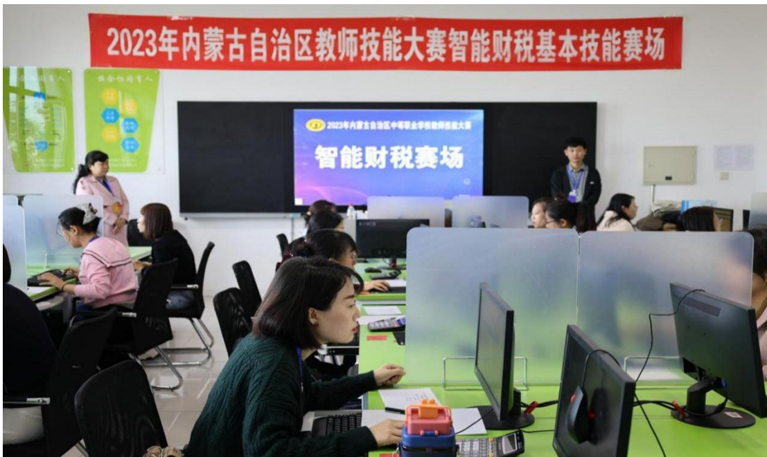
图 13 教师参加 2023 内蒙古自治区中等职业学校教师技能大赛