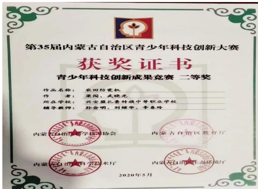
图 11 学生参加科技创新大赛获奖