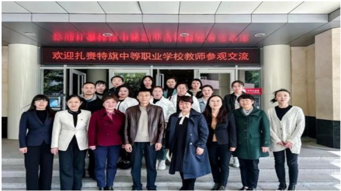
图 37 赴北京丰台区参加跟岗研修、骨干教师培训