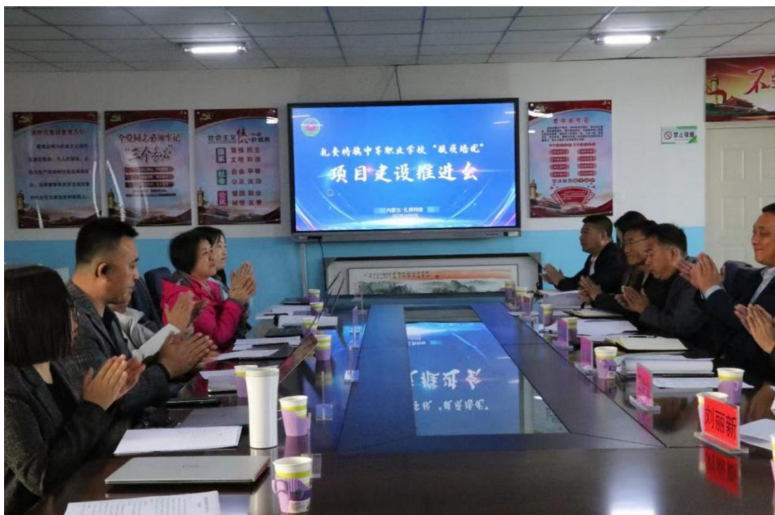
图 35 “提质培优”项目建设推进会

计事务专业、幼儿保育专业、汽车运用与维修专业和护理专业获批“1+X”证书制度试点；新增 VR 虚拟仿真实训室 1 个，学校办学质量水平实现新的提升。