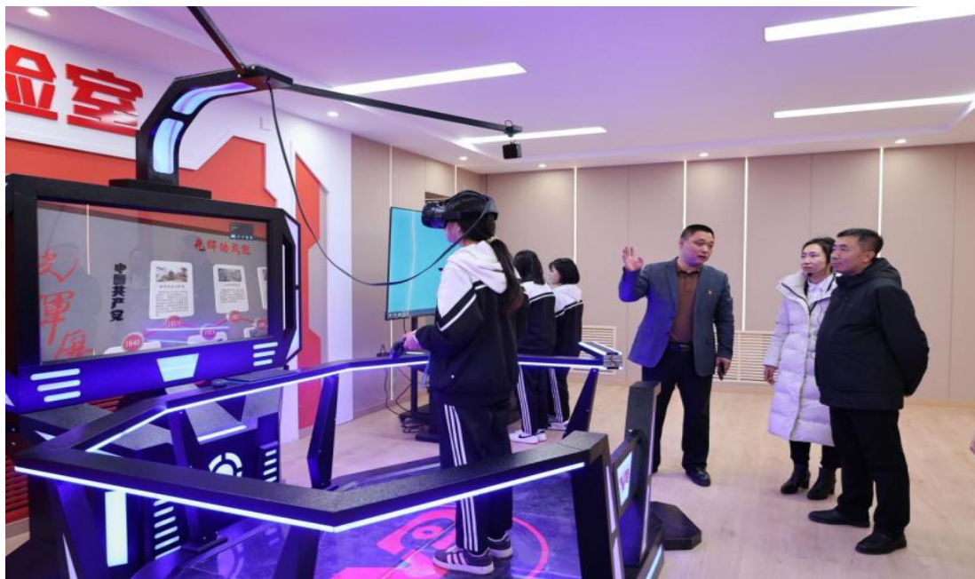
图 25 师生 VR 体验红色历史事件

扎赉特旗中等职业学校位于祖国北疆草原，红色文化教育资源相对匮乏。学校建设党建 VR 体验室，将红色文化教育资源嵌入平台，通过发挥 VR 技术打破时空限制优势，让师生更好地了解中国共产党的发展历史和中国革命的历史进程，更加生动地感受重大历史事件的真实性和完整性，更加深刻把握事件的背景、原因和意义、价值。VR 体验室让革命历史事件重现，师生身临其境体验重大历史事件的发生发展过程，不仅丰富了历史知识、提高了历史素养，也激发了爱国热情和民族自豪感。VR 体验室在学校传承红色基因和培养师生民族精神方面发挥了重要作用。