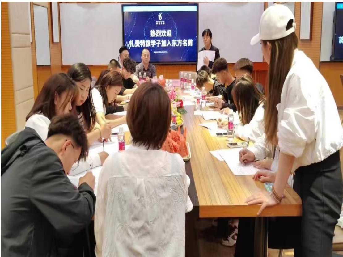
图 29 美容美发学生入企开启现代学徒制之旅

学校与北京东方名剪美容美发有限公司深度合作，双方共研人才培养方案、课程设置，共订教学计划，共同实施理论和实践教学，共建 300 平方米实训基地。校企围绕人才培养方案推行工学结合、双导师制，从专业理论教学、岗位技能实操、形象设计、营销策划、运营管理、创业能力培养、实习就业等方面开展全方位合作。学校负责招生和日常教学及管理，企业负责新技术、新技能培训 and 岗前培训，选派高级技师做技术指导，开展“双师型”教师培养，推动现代学徒制人才培养，双方为高端服务业发展、高品质民生需求培养更多高素质产业技术技能人才。