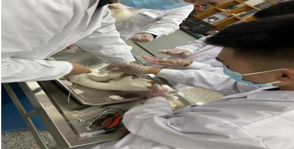
图 10 学生参加科技创新大赛训练

思维和创造力，提升就业竞争力和就业机会，为学生未来职业发展打下坚实基础。组织学生参加各类创新创业大赛，着力培养有责任、有担当、有创新创业能力的双创人才。在第三十五届内蒙古自治区青少年科技创新大赛中，农学专业学生制作的“农田防雹机”获得大赛二等奖；汽修专业学生设计的“车载酒精检测仪”获得大赛三等奖；畜禽生产技术专业学生设计的“动物外科手术皮肤粘合法的应用”获得大赛三等奖。