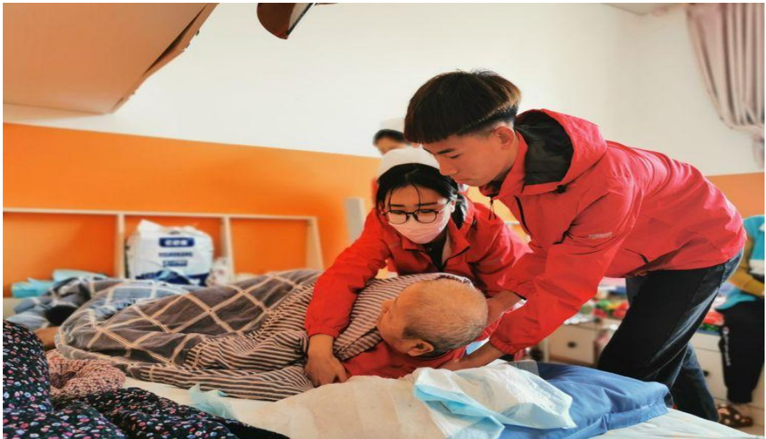
图3 志愿者为老人做护理保健