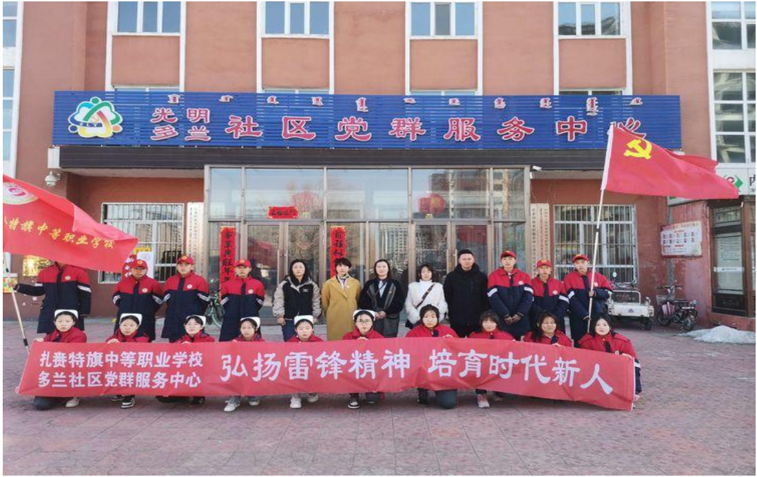
图2 志愿服务活动合影