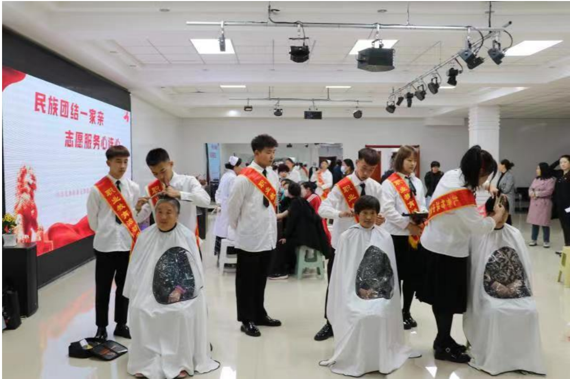
图 22 学生进社区为群众免费理发、测量血压