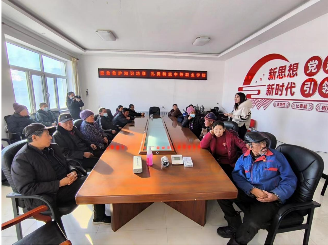
图 18 涉农专业教师线上授课