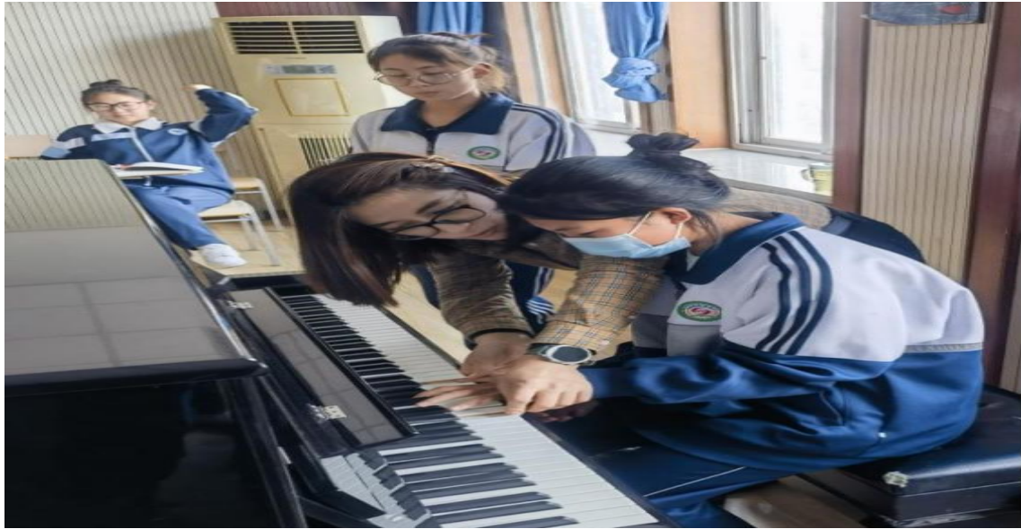
图 32 六名建党立卡学生到北京丰职访学 30 天