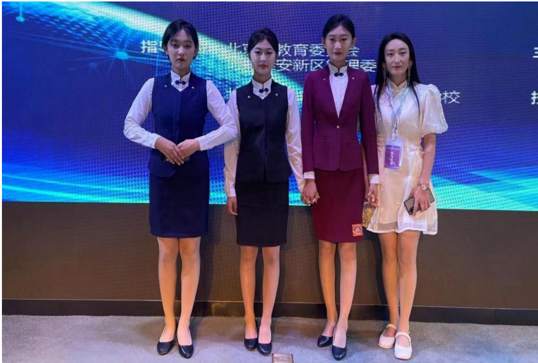
图 12 学生参加“京雄”职业院校学生技能大赛中职生礼仪赛项