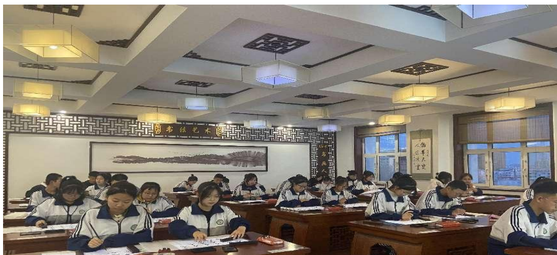
图 23 书法社团常态化开展

练习不同字体，支持学生参加各种书法竞赛。学生在书法社团体会了中国书法的独特魅力和博大精深，提高了对传统文化的兴趣，提升了文化素养和审美能力，增强了对中华书法的自豪和对中华文化的自信。书法社团在内蒙古自治区职业学校师生技能成果展获得一等奖、全旗中小学生艺术节获一等奖、“廉洁润初心，清风扬正气”廉洁文化作品获一等奖。