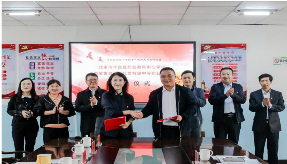
图 30 签署 2023 年“手拉手”教育合作协议