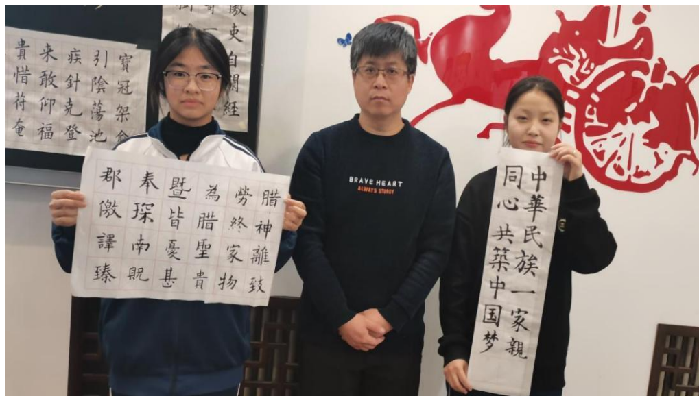
图 24 书法社团作品展示