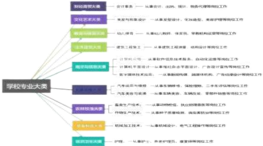
图 4 学校专业大类

业设置，2023 年增加了数字媒体技术应用、汽车美容与装潢 2 个专业。目前学校会计事务是区级特色专业，建筑工程施工、计算机应用专业是区级重点专业，幼儿保育、汽车运用与维修、护理正在打造区级优质专业。