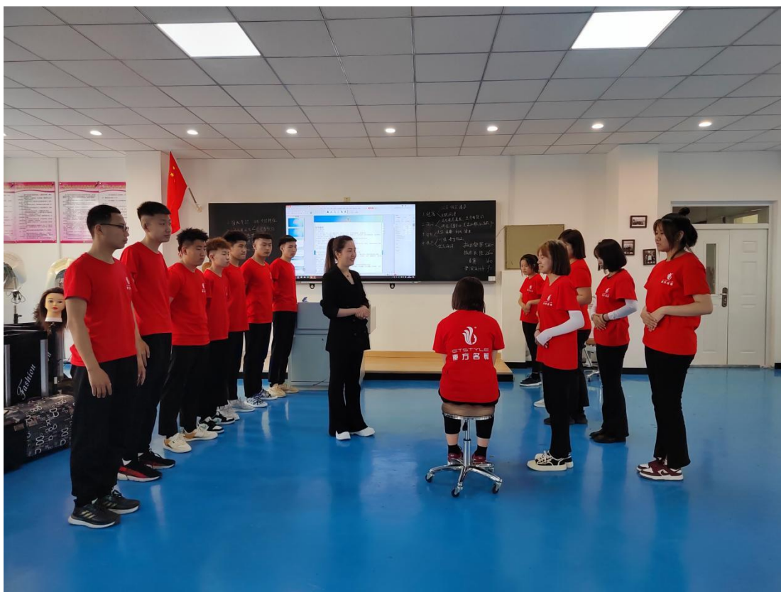
图 26 学员在美发基地培训

工匠精神。学校美发与形象设计专业将东方名剪企业文化纳入到专业教学和管理，学校专任教师、东方名剪公司选派专家向学生讲授公司文化，让学生了解东方名剪“技术精、服务优、信誉高”的品牌内涵，“创新卓越、力求完美”的品质观，“4S 服务（微笑 SMILE 诚恳 SINCERITY 灵巧 SMART 迅速 SWIFT）、诚信经营”的服务观，以及标准化、科学化、简单化、数字化的“四化管理”理念，确保公司文化与校园文化有机融入专业建设、实训基地建设，学生在进入公司实习、就业前认同东方名剪企业文化。