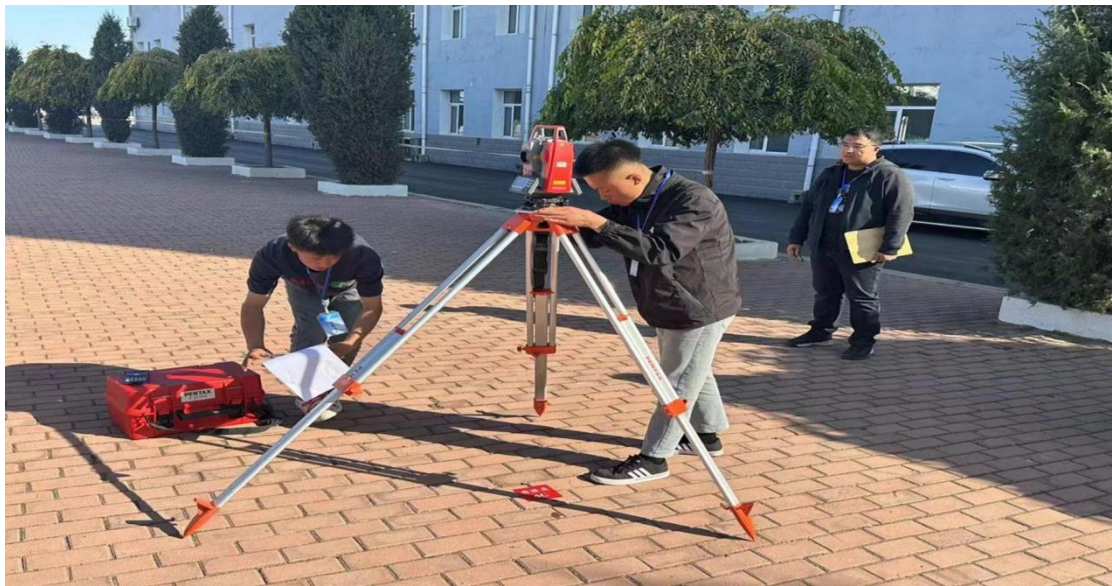
图 14 建筑工程施工专业学生积极备赛