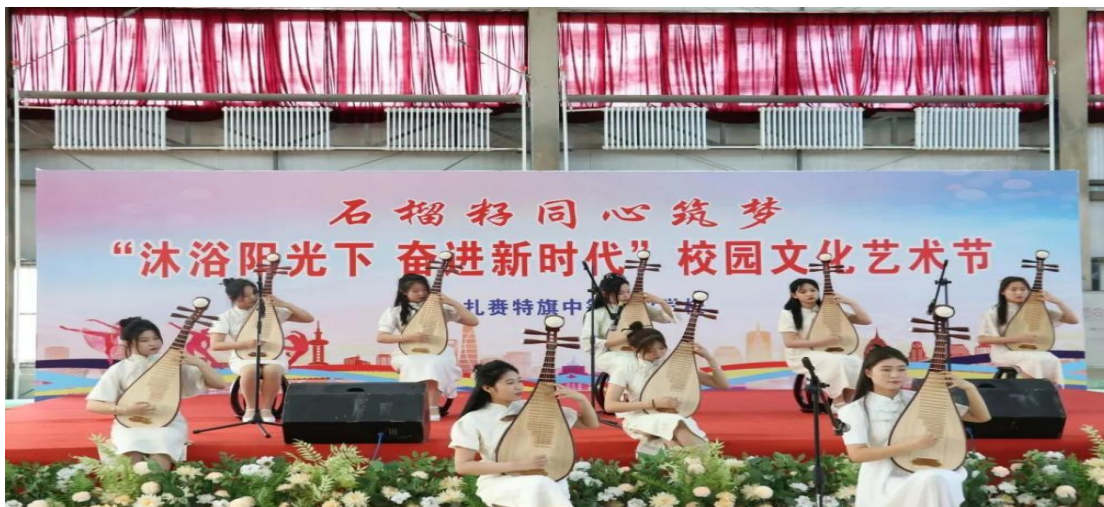
图1 校园文化艺术节琵琶重奏《阳春白雪》

学校深化民族团结进步教育，以迎接民族团结进步创建活动示范单位复检为契机，打造民族团结文化长廊，大力弘扬蒙古马精神和“三北精神”，宣传“五句话”的事实和道理，充分运用“北疆文化”进一步铸牢中华民族共同体意识。广泛开展中华经典诵读、中华传统技艺传承和石榴籽同心筑梦等活动，组织多姿多彩的社团活动，搭建学生展示自我平台，充分发挥校园文化在思想政治引领、道德规范约束和文化氛围熏陶等方面的作用，不断陶冶学生道德情操，提升学生审美能力和艺术修养，培养厚德强技的高素质技能人才。