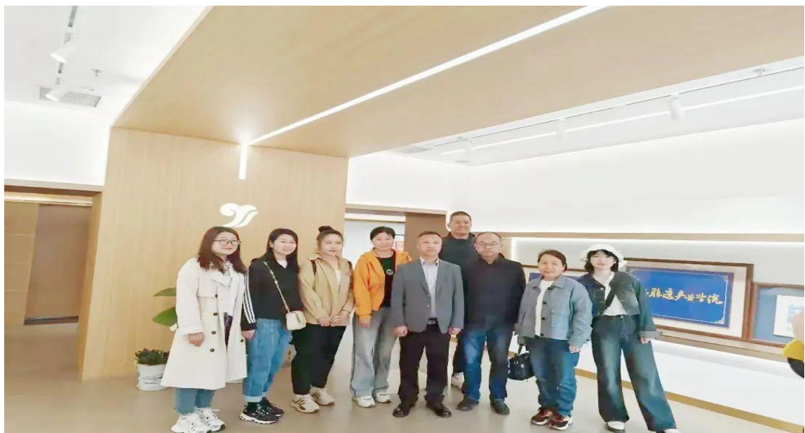
图 31 六名干部教师到北京丰职跟岗研修 14 天

扎赉特旗中等职业学校借助“组团式”帮扶，不断提升发展内涵和办学质量。对接建专业，与帮扶校北京市丰台区职教育中心学校影视融媒专业群、汽修专业人才培养方案、课程体系等对接，2023 年新设了数字媒体技术应用、汽车美容与装潢 2 个专业。共同搭平台，通过京雄（安）蒙技能大赛，助力学校师生以赛促学提升专业能力。聚力强队伍，组织 3 批次 26 名干部、教师到北京丰职跟岗研修，帮扶团队采取“一带三”带教、示范课、说课等模式，助力学校师资队伍整体提升。协同育学生，组织到北京丰职访学，助力学生开拓视野，提高综合素养和专业技能。