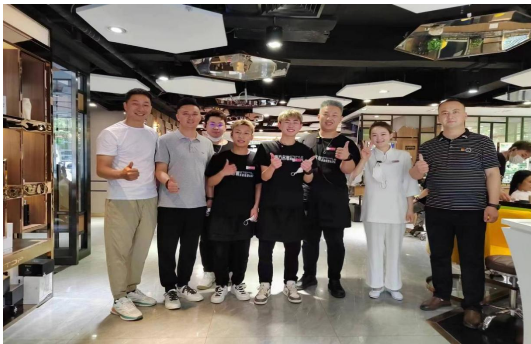
图 28 学生在实习单位实习

星电子厂顶岗实习，23 名美发与形象设计专业学生分两批到北京东方名剪连锁有限公司各门店实习，15 名学生到旗人民医院实习，30 人到旗第三幼儿园实习，为学生提高实践能力、职业素养和就业、升学打下良好基础。