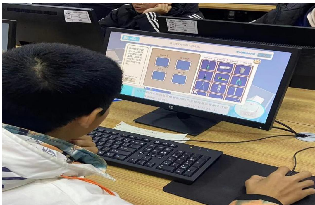
图 17 组织社会人员进行新能源证书考试

扎赉特旗中等职业学校 2022 年底获批内蒙古自治区高技能人才培训基地。为了更好地发挥职业教育为旗域经济发展的服务职能，2023 年 11 月-12 月，学校面向全旗汽车行业开展了“新能源汽车业务培训及考核”，为企业员工提供专业的技能培训服务，助力企业员工适应新能源汽车行业发展需要，掌握、提高新能源汽车修理技能水平。近三年来，学校持续为当地汽车修理企业输送既懂传统汽车修理，又掌握新能源汽车修理知识技能的优秀毕业生，满足汽修企业对高素质技术技能人才的需求，助力企业持续发展，也提升了职业教育的认可度与吸引力。