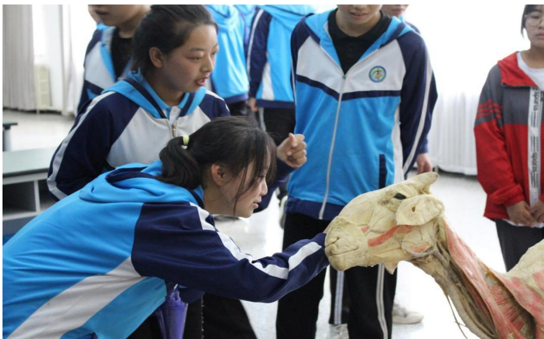
图 9 初中校学生到畜禽生产技术专业参加职业体验活动

学校 5 月份开展了“学生职业体验活动”。旗内六所中学的学生走进扎赉特旗中等职业学校，体验现代职业教育特色与魅力，为未来职业发展启蒙。学校结合专业特点和资源优势，安排了汽车运用与维修、会计事务、护理、幼儿保育等专业的体验活动。参加体验的初中学生亲身体验了化妆、电路焊接、种子质量检测、四等水准测量、新能源 VR 展示、3D 打印机、点钞、心肺复苏、舞蹈等专业课程和专业设备的使用。实践活动增强了学生们对职业教育的认识认同，了解不同行业的职业需求和工作环境，有利于初中学生提前规划人生、理性选择职业。