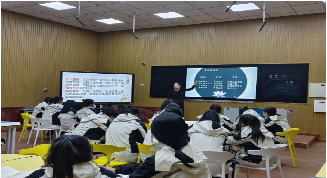
图 38 骨干教师公开课