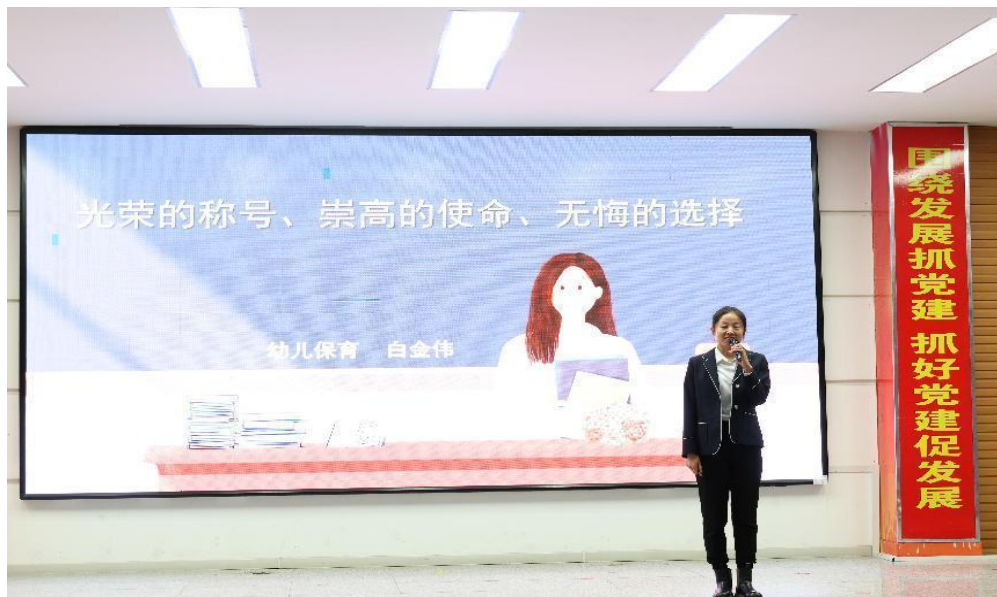
图 34 教师参加师德演讲比赛