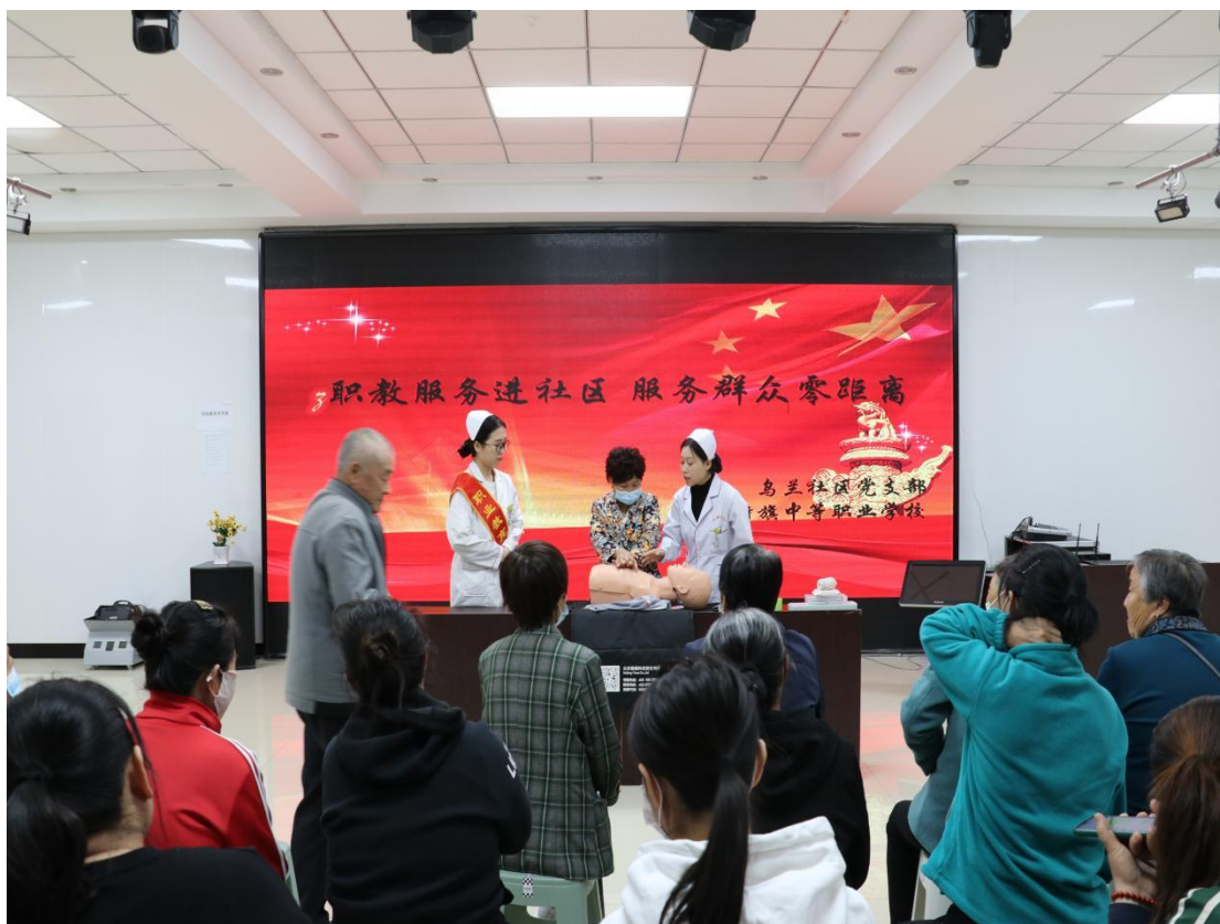
图 21 师生开展老年人急救培训

5月16日，护理、美发专业教师带领学生走进乌兰社区，利用专业技能服务居民。护理专业开展“我为社会办实事”活动，帮助社区居民测量血压，科普健康知识和护理常识，让居民在家门口享受到贴心服务。美发专业学生用娴熟的理发技术、温暖周到的文明礼仪为每一位前来理发的居民热情服务，深受群众欢迎。职业技能进社区，展示了学生学习成果，为社区居民了解职业教育、认可职业技能开辟了窗口，也为学生展示职业技能素养提供了平台。